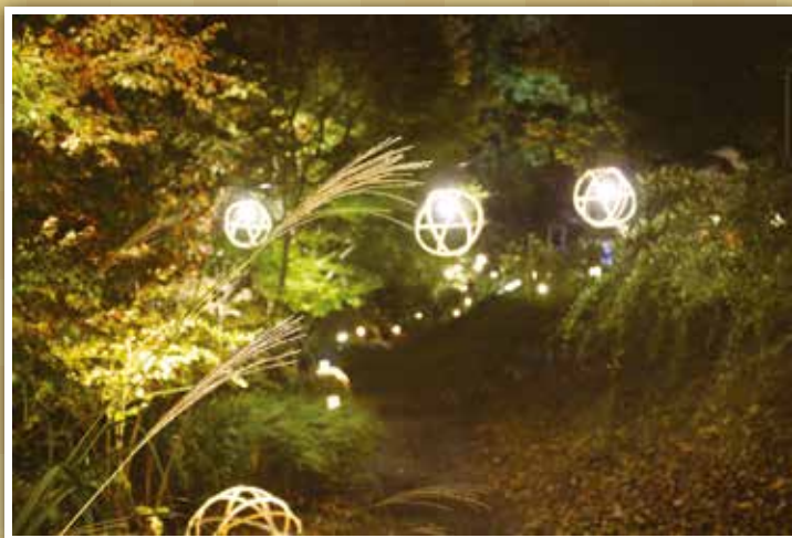
↑「ススキと遅い秋」仙台市若林区 山元のリングリングさん